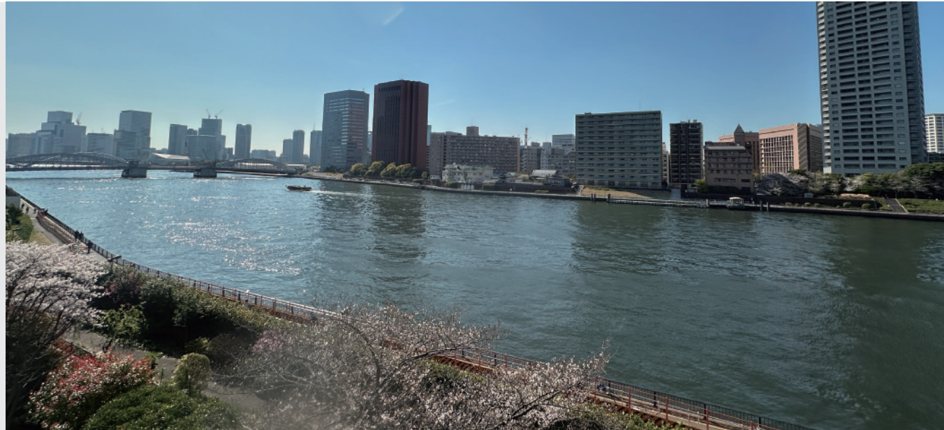
◀北西側バルコニーより(隅田川を望む)