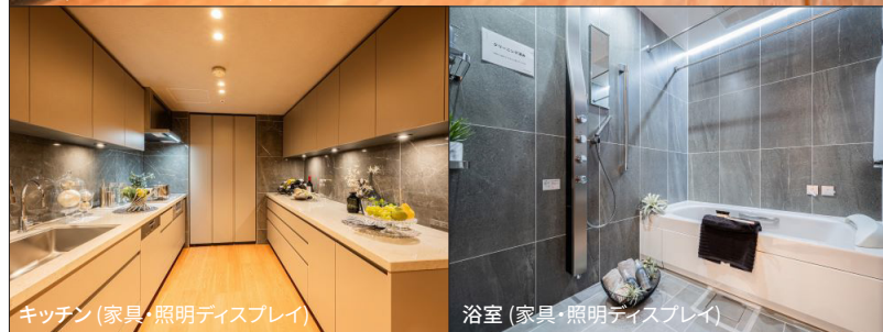
キッチン (家具・照明ディスプレイ)