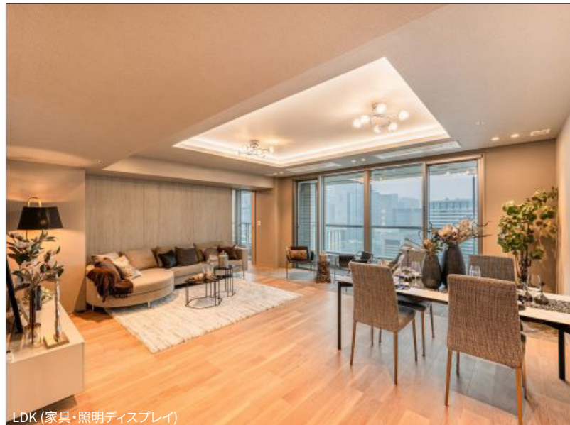
LDK (家具・照明ディスプレイ)