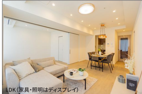
LDK(家具・照明はディスプレイ)