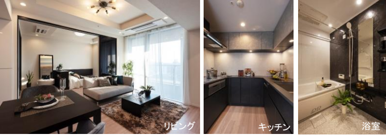
※家具・調度品は販売価格に含まれません。※眺望は将来に渡って保証するものではありません。

tukurite 明和地所が創る自由で CLIO STYLE RENOVATION 高品質なリノベーション リフォーム内容(2024年6月完了) ~新規交換~ ■システムキッチン(食洗器、ディスポーザー付き) ■洗面化粧台 ■ユニットバス(浴室乾燥機付き) ■天井カセット式エアコン2基 ■ロスナイ(全熱交換器) ■建具 ~その他~ ■床フローリング上貼り ■内装クロス全面貼替 ■床タイル張替