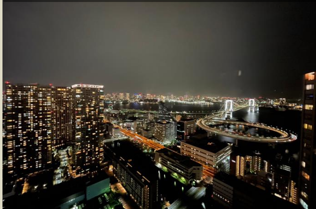
■ Rainbow Bridge view