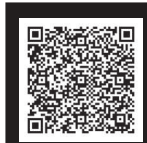
アクセスマップ グーグルマップが 開きます。