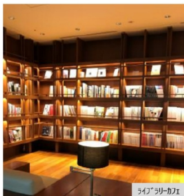
ライブラリーカフェ